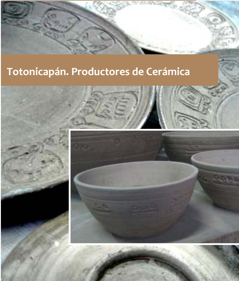
Totonicapán. Productores de Cerámica