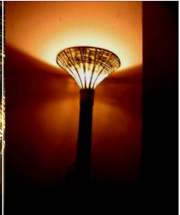
Cooperativa COPIKAJ en Santa Clara. Fibra de Caña