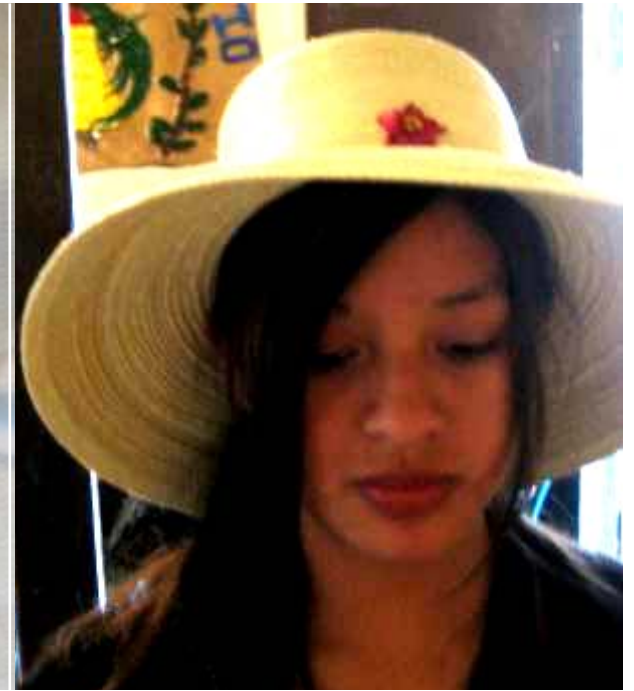
Quiché, Cooperativas de Fibra de Palma