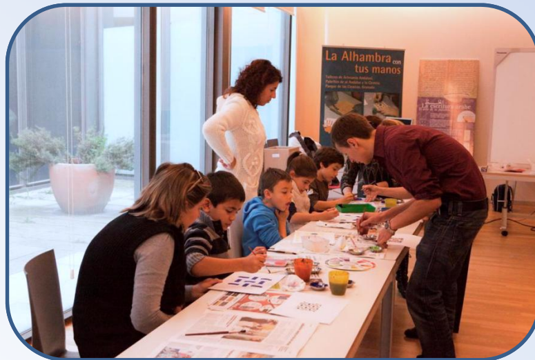
Taller de color dirigido a niños con ejercicios prácticos sobre la aplicación del color según los principios y reglas cromáticas del «zellij».